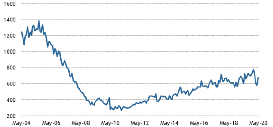
New Home Sales (thousands, SAAR)

ABD Şubat yeni konut satışları -4.4% 765k olarak gerçekleşmişti.