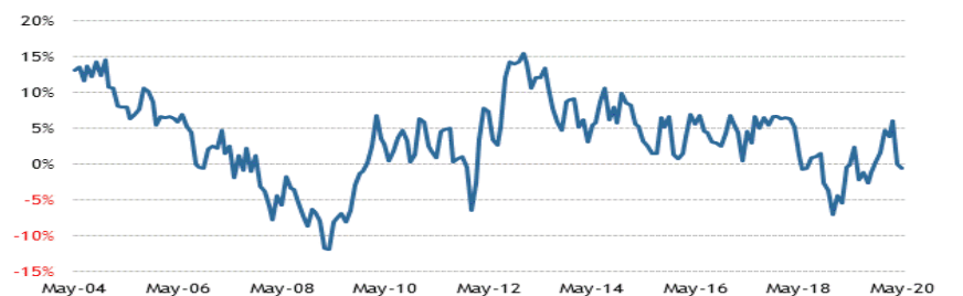
Median New Home Prices 3-Month Average y/y%